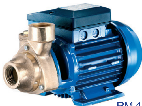
PM 45 BR