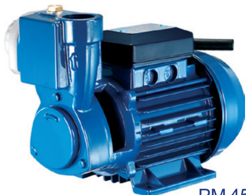
PM 45 A