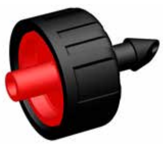
2 L/h PCND