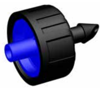
4 L/H PCND